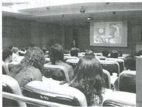
◀ 95 整體療法 高雄場