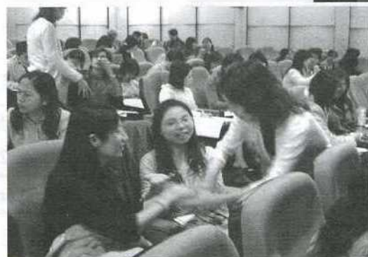
▲ 95 應用行為初階班～嘉義場