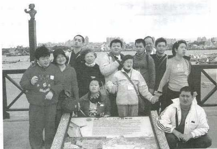
▲ 本會附設職前準備中心～星兒職訓所之戶外教學