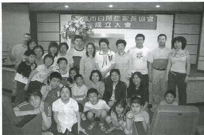
基隆市自閉症家長協會成立～基隆的家長有福囉！