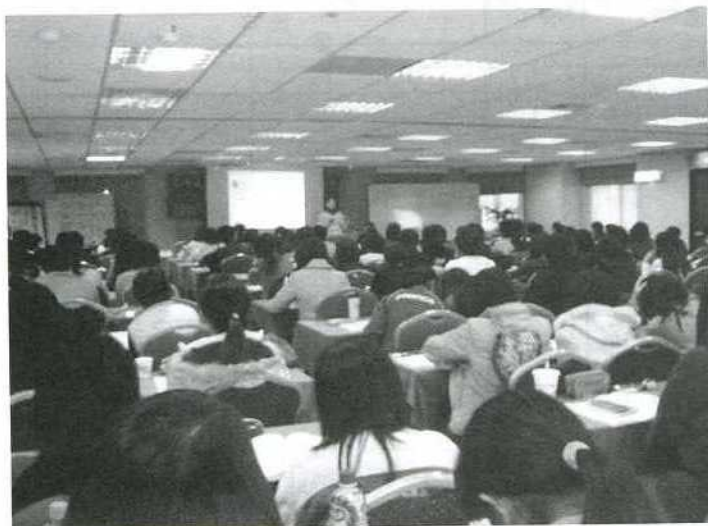
▲ 95應用行為初階班～台北場