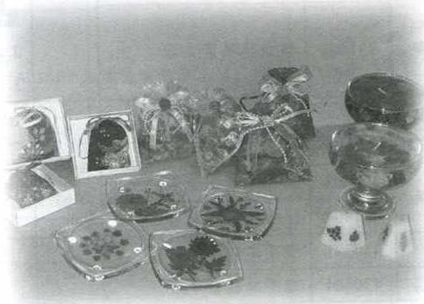
▲ 本會附設庇護工場～星兒工作坊之產品，歡迎您前來訂購！