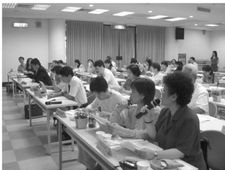
▲ 95學年度身心障礙學生12年就學安置會議