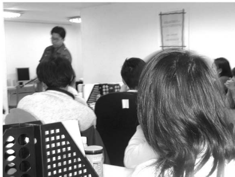
◀ 早療中心全體參加消防安全講座