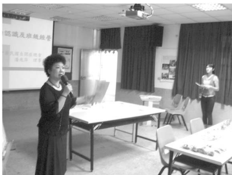
▲ 石門國中宣導「自閉症的認識及班級經營」