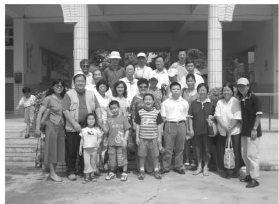
▲ 第四屆第七次理監事會議開會及參觀財團法人高雄縣私立星星兒社會福利基金會相關機構。