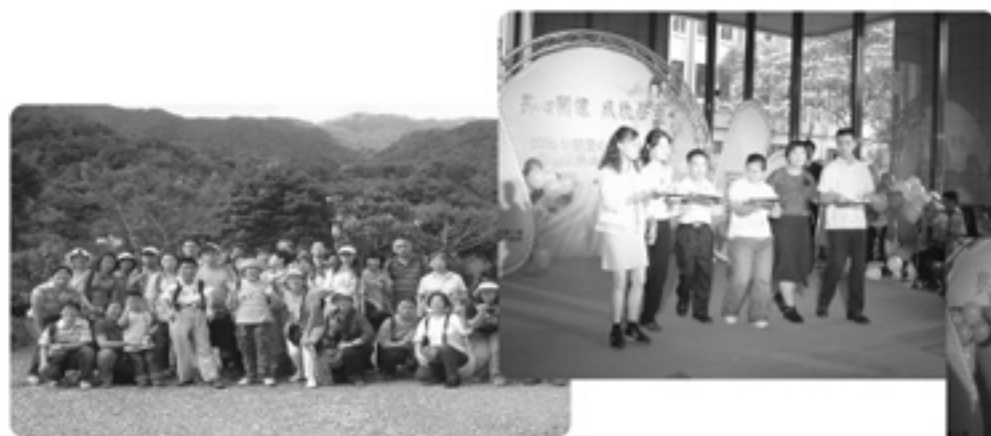
▲本會庇護工場及職前準備親子旅遊-宜蘭頭城農場