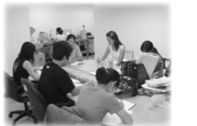
▲本中心老師，開學生IEP會議