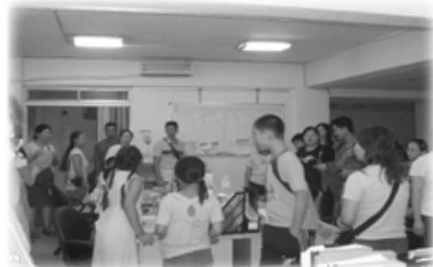
▲宜蘭縣自閉症福利協進會參觀療育發展中心