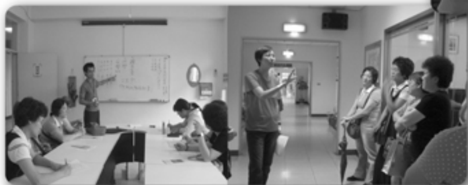
▲ 本會參訪台北市立聯合醫院松的院區青少年日間留院（左）、成年日間留院（右）