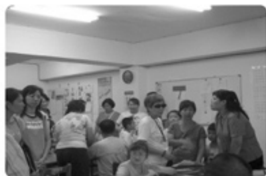
▲宜蘭縣自閉症福利協進會參觀本會職前準備、庇護工場