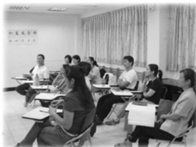
▲家長團體課程— 知星成長班