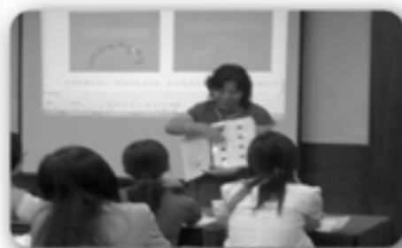
▲ 95應用高階班研習會