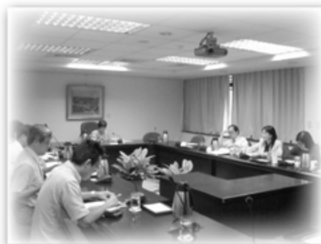
拜會行政院衛生署