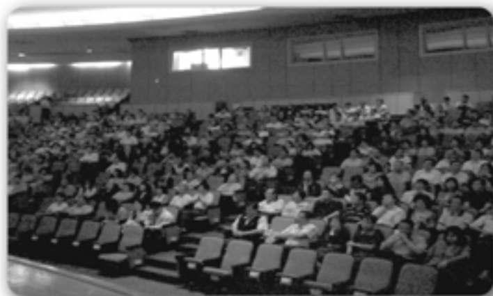
◀ 8月台灣鐵路局宣導 「身心障礙者及其基本權益之尊重與保障」