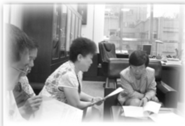
▲拜會行政院職訓局蘇麗瓊副主委