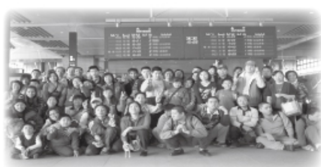
▲北區團體會員搭乘高鐵出遊去...