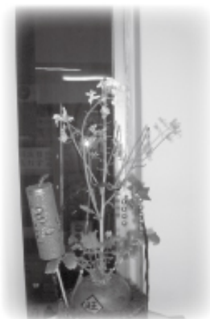
▲本會產品-菜頭開花囉!!! 您購買回去也可以如此喔!!!