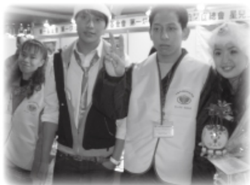
▲藝人林伊晨與工作坊學員合照