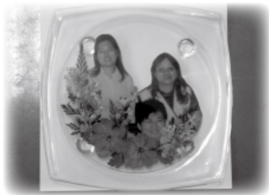
▲本會新產品-您可以擁有專屬的照片，成為獨一無二的杯墊