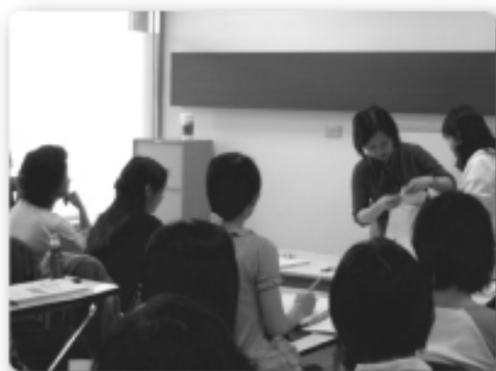
960915認知教學入學準備篇課程照片