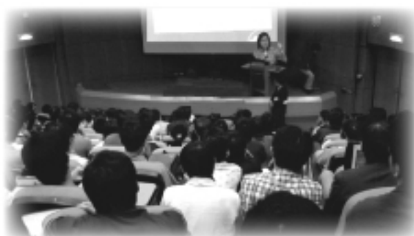
96年度「與國際接軌 之自閉症療育法系列研 討會」