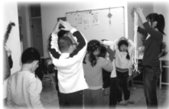
台北協會課程剪影-遊戲人間