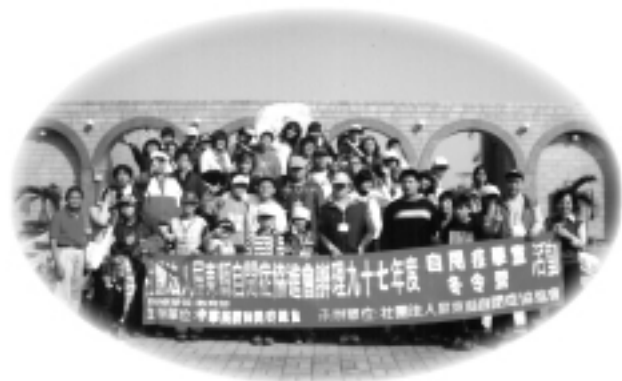
屏東協會活動留影-大合照