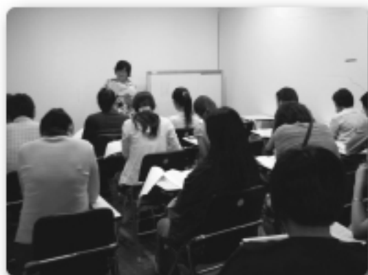
知星成長班第四期上課照片