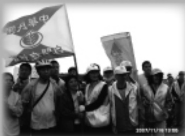
新竹市自閉症協進會