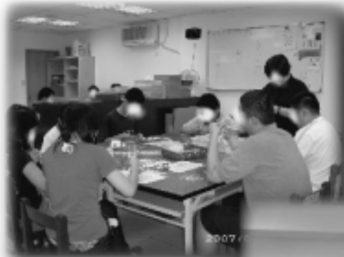
星兒們認真做代工