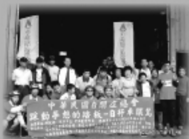
桃園縣自閉症協進會