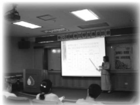
96年度身心障礙者就業宣導 座談會|桃園協會