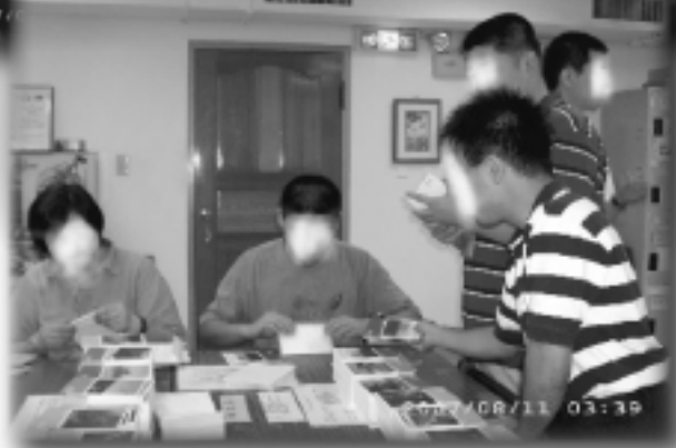
星兒們用心學習做事