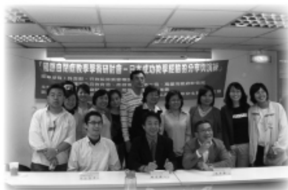
「國際自閉症教學學術研 討會」日本成功教學經驗的 分享與演練