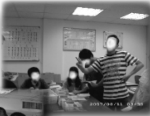
星兒們用心做作業