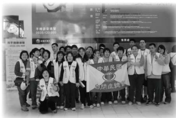
▲本會星兒工坊參觀『普普教父：安迪·沃荷世界巡迴展』