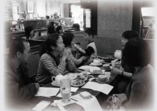
第五屆第二次中區理事長聯誼會