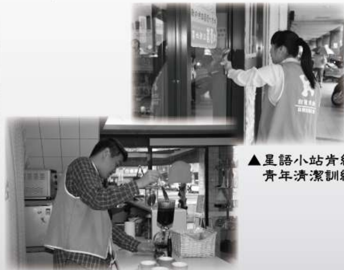
▲星語小站肯納青年清潔訓練