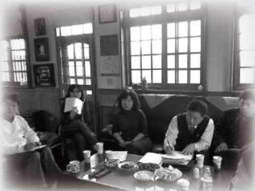
第五屆第二次北區理事長聯誼會暨社工聯誼