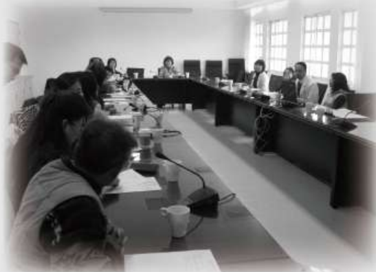
桃園療養院-衛生署會議『爭取衛政相關議題』。

3月17日的公聽會雖圓滿達成，但對於政府官員所做的回應，我們必須監督，因此這不是一個結束，而只是一個開端，總會和所屬的20個團體會員，將會針對自閉症相關的議題再與政府持續溝通、爭取，為自閉症者及其家庭努力。