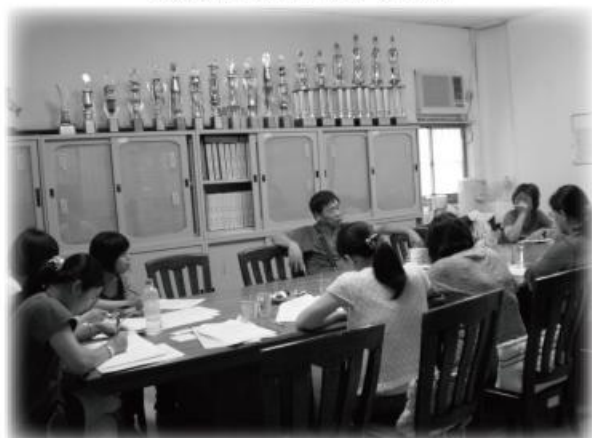
自閉症巡迴服務車—誠信愛心家園