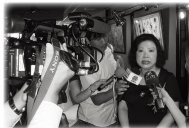
↑ 記者會現場相關新聞媒體蒞臨採訪

本次繪畫甄選分為四個組別：學齡組(6歲以下)、國小組(7~12歲)、青少年組(13~18歲)、成人組(19歲以上)，共計收到349幅作品，並選出46幅得獎畫作(學前組:7幅、國小組:14幅、青少年組:15幅、成年組:10幅)，展期從七月二日至七月十一日於國立台灣師範大學博愛樓進行十天的展覽，免費邀請各地民眾前往觀賞，每一幅畫都訴說著每位星兒不同的內心世界，期待大家的一同來發現。