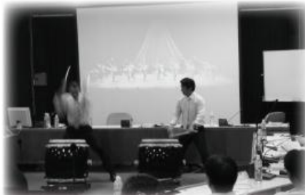
↑日本 富岳會太鼓表演