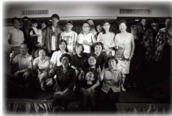
↑晚宴嘉賓全體合照

自閉症總會為了邀請更多社會大眾來瞭解這群與眾不同的孩子，並讓更多人看見星兒的特殊音樂天賦，特別於這一屆7/8、7/9為期兩天的『國際自閉症機構學術交流研討會』舉辦期間，結合發表「星兒音樂晚宴」，希望以音樂開啟星兒與一般大眾的溝通橋樑，讓社會大眾欣賞到不一樣的星兒，為了讓『星兒音樂晚宴』能有正式晚宴高質感的呈現，總會即使在資金不足的情況下，仍不惜包下凱薩的希爾頓廳，讓星兒有個優質的場地可以盡情表演，也讓參與的貴賓除了聆聽優美的星兒演奏外，還有美味的自助餐晚宴可以享用。