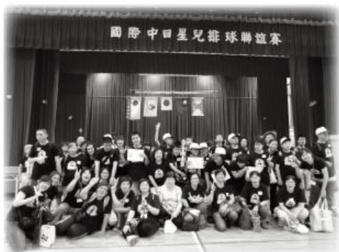
↑ 星兒工坊全體人員大合照