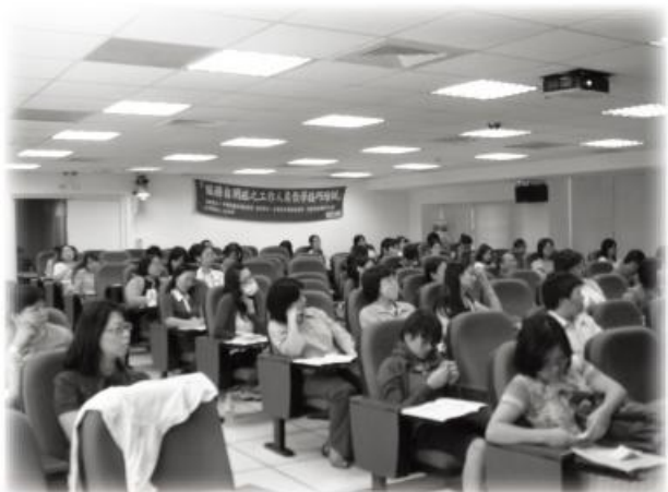
↑課程反應熱烈，由於上課人數過多 所以換至大教室上課

今年度第一次開辦的自閉症教學課程，課程內容從淺入深介紹自閉症的各種理論基礎以及教學方式，共開設138小時的研習課程，此次課程反應熱烈，參與的學員包含特殊教育教師、心理師、治療師、家長…等；目前，課程已將進入尾聲，學員們認真地於每周六、日前來上課，都希望藉此習得更專業的教學技巧，以嘉惠更多的自閉症者。