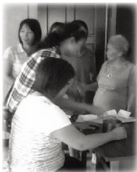
↑台北縣身心障礙者福利促進協會