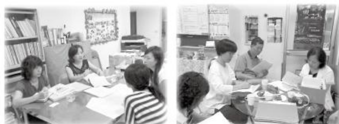
「會計巡迴輔導」服務情形