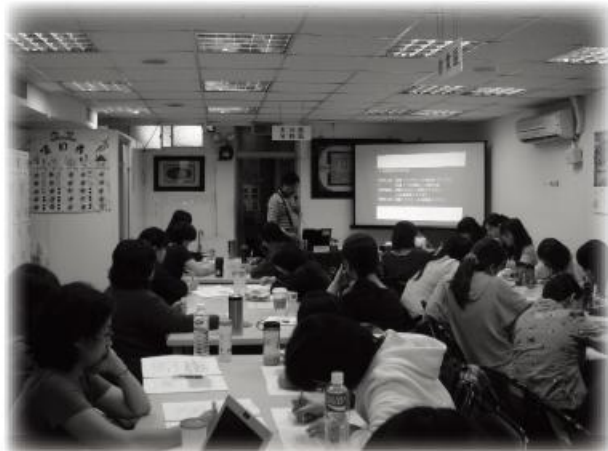
↑每位學員認真聽講