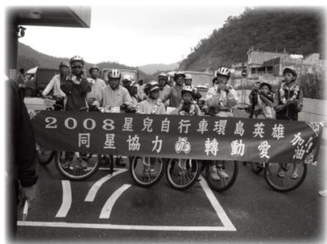
第二屆自行車環島英雄們大合照