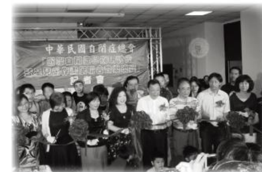
↑ 記者會所有嘉賓為畫展活動剪綵

自閉症者因為不善與外界溝通，就如同住在遙遠的星球般，因此人們為他們取了「星星兒」的小名；然而，也正因為如此許多自閉症者在色彩搭配及事物觀察上，有著不同於常人獨特的見解，從而展現出許多另人驚艷的藝術作品；因此，本會於今年度辦理第一屆「自閉症者繪畫展覽」，簡章發出後各地如雪片般的作品陸續寄來，收到的作品數量超乎我們的預期，讓我們更加相信這樣的努力是值得的，雖然只有獎狀的鼓勵，但對這群隱身社會角落的弱勢孩子都是莫大的鼓勵！