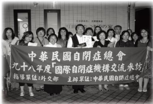
參訪團與日本機構人員合照

(五) 自閉症患者要特別注意是否伴隨精神疾病(情緒障礙、癲癇、強迫症、ADHD)