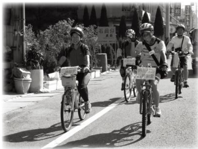
每位騎士努力不懈地踩動環島的夢想