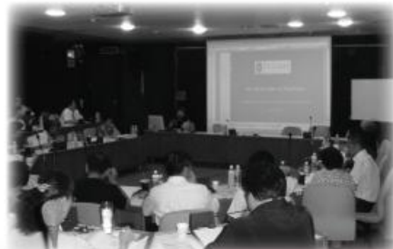
↑美國 Peckham Headquarters