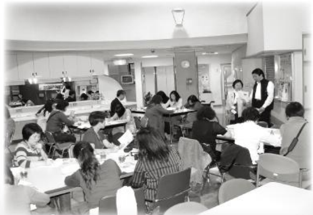
日本機構人員介紹機構服務情形