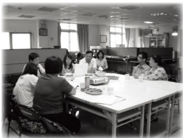
↑宜蘭縣自閉症者福利協進會

自閉症巡迴輔導自去年度起開始服務，接到來自各個學校、機構、早療中心、教養院的申請，在評估去年的服務情形及需求後，今年特別針對身心障礙機構提供輔導服務，希望透過此方案以補充特殊教育的資源，讓自閉症者擁有更好的教學及照顧品質；礙於交通因素，本會服務範圍以北區為限，今年度已前往台北、宜蘭、基隆、桃園等地之機構進行服務，未來也會持續提供服務，讓這群站在第一線服務的教師以及家長，可以在面對自閉症者的情緒及行為問題時，有更實用更有效的處理方式。