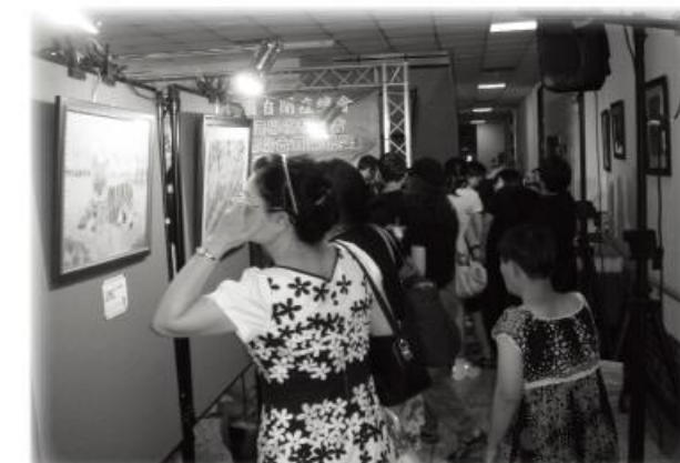
↑ 每一幅畫作皆讓人不禁細細品嚐起畫中韻味