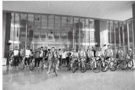
在高雄市政府前與星星兒社會福利基金會會合

10月20日高雄康橋飯店至高雄市政府接受媒體聯訪，之後前往高屏大橋與屏東縣自閉症協進會會合，並由協會安排前往餐廳用餐！下午行程一路至墾丁，墾丁福華水世界經理及工作人員有歡迎儀式及記者聯訪，並且有4位草裙女郎在飯店前迎接我們，6位小騎士樂得和她們拍照。