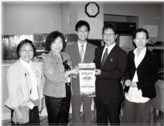
由本會潘副理事長頒發錦旗感謝日本富士福社會的熱情招待與介紹