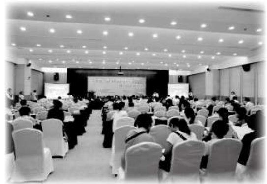
(此次國際性交流講座吸引滿滿的人潮)