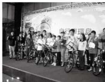
由各個嘉賓頒發證書給自閉症環島騎士！

。最後回到出發地台北與總會會合，因天候很冷又下雨，大夥直奔用午餐地點休息，之後教練考量全體上車抵達英雄大會現場。下午兩點英雄大會開始，由星兒特攻隊熱情出場表演精彩歌舞揭開序幕，貴賓致詞並贈送6位小騎士