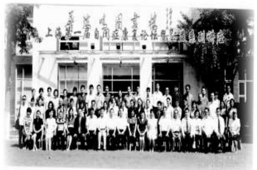
本會受邀參與第一屆上海自閉症論壇