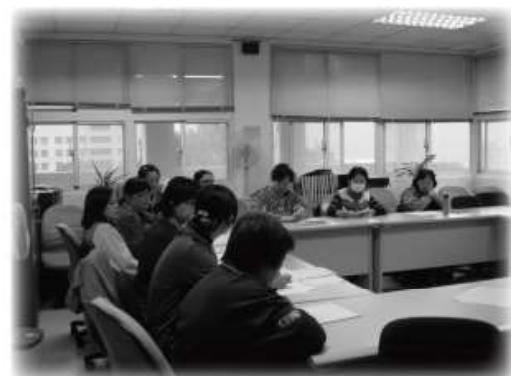
「自閉症巡迴服務車」輔導情形(陽明教養院)