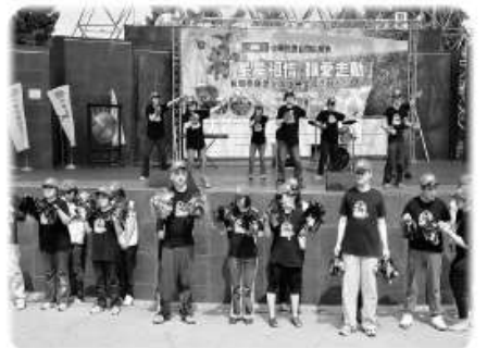
由星兒工坊的星兒們進行開場舞的表演