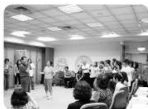
賴老師示範嚴重行為問題緊急措施