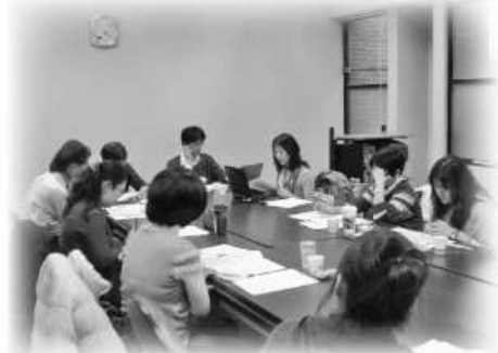
100/05/03「字母版溝通法工作坊」督導會議