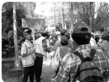
星星補給站活動情形