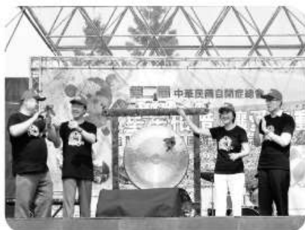
內政部 江宜樺部長(左二)、國民健康局 邱淑媿局長(右二)以及立法委員謝國樞先生(右一)一起敲響大鑼

所有人戴上充滿熱情朝氣的紅帽子後開始健走，健走路線中設置四個星星補給站，每位參與者拿出手中精美的活動手冊，讓我們的活動人員蓋下星星戳章，集滿戳章後就可以快速前往我們的服務台領取餐盒、礦泉水以及小贈品！補充一下剛剛辛苦健走後的元氣，繼續參與接下來一連串精采有趣的活動！