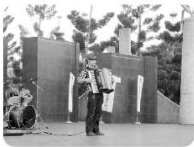
風琴樂曲 — 浩浩