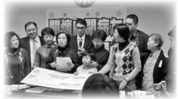
100/03/31「星星相惜 讓愛走動—自閉症健走暨園遊會活動」記者會