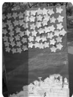
遊戲區 — 星兒高高掛