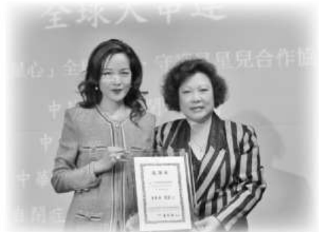
100/04/01「手牽手 護星心」守護星兒合作協議簽署