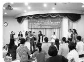
賴老師指導學生練習