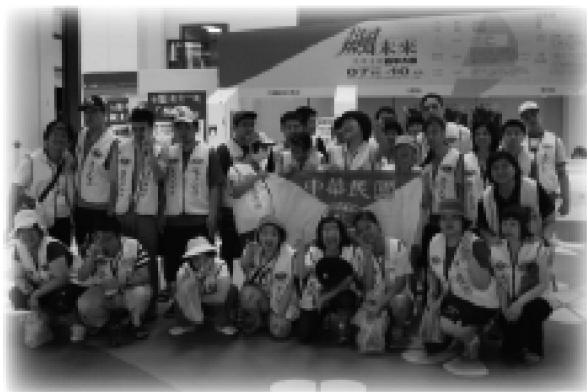
中正紀念堂颯未來展覽

為讓作業者能認識社區及走出戶外，工場不定期安排作業者參與戶外教學，包含展覽參觀、社區戶外活動等等。同時讓作業者與社區人民互動，並宣導戶外安全知識。