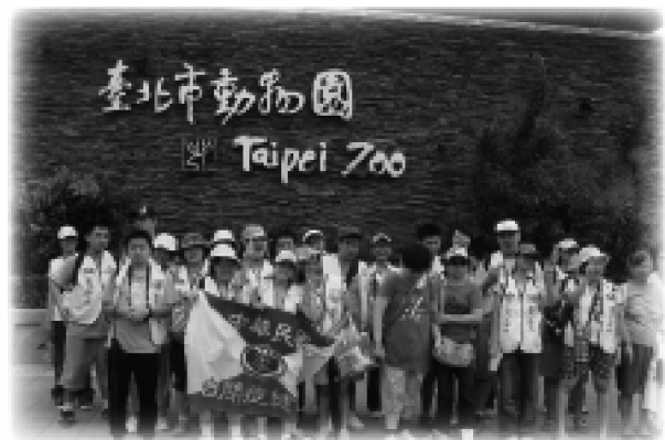
近期活動：台北木柵動物園一日遊