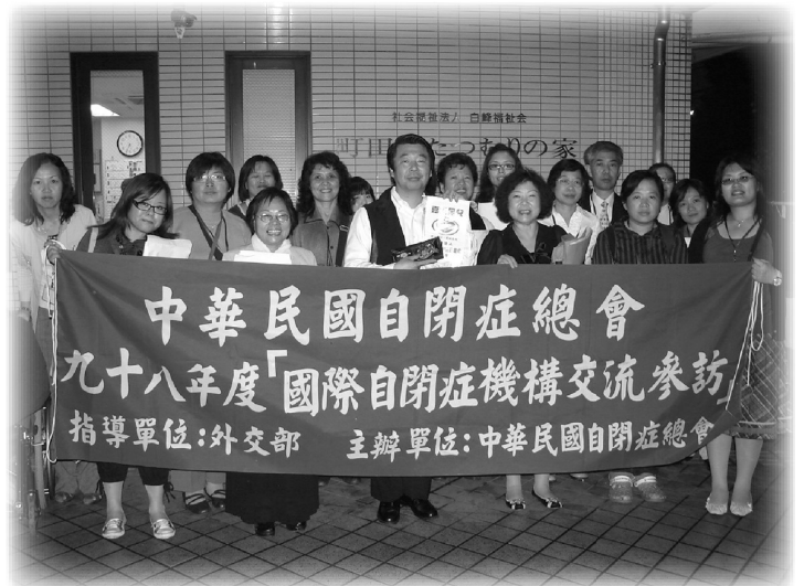
▲ 社團法人白峰福社会かたつむりの家