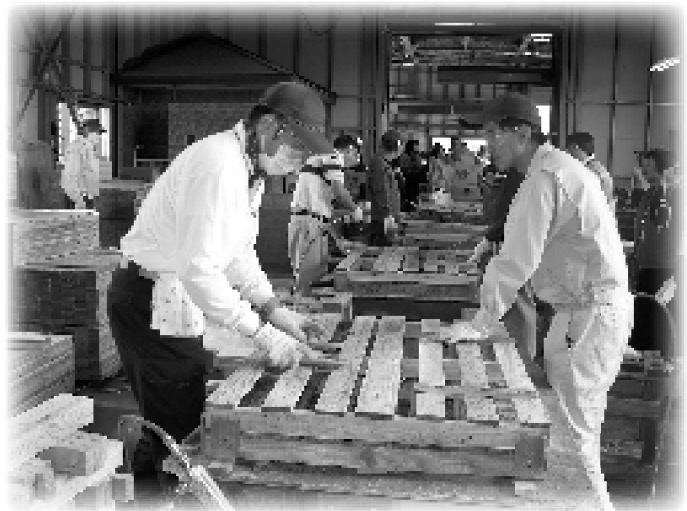
▲ 檺木鄉自閉症者工作情形