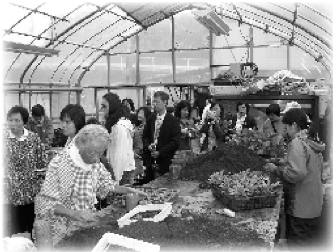
▲ 町田ダリア園作業者工作情形

時，若是先給予1對1的教導，讓他熟悉環境、規矩、作息等等之後，在到大團體之中，一方面可以減低對環境及作息焦慮、一方面也讓他學習正確的技巧，到團體中也比較跟的上，不會像現在台灣大多數的機構，個案進來後就跟著大家一起，而自閉症者還搞不清楚環境、作息等，就要一直做，又不了解步驟，所以就會有情緒、也會有挫折感。而若是依照日本的做法，使個案有較高的穩定性，而人力比的部分，機構就可以更容易的去運用。