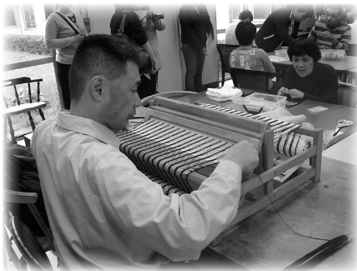
▲ さつき學園自閉症者學習紡織中

我們乘風破雨的安全抵達日本，在這個國度中將渡過五天四夜，只有第一天的夜晚大家可以輕鬆的、悠閒的隨意逛街、購物。接下來的幾天，就沒有任何休閒時刻，因為我們在短短的三天半中，要參觀九個機構（弘濟學園、町田ダリア園、社会福祉法人白峰福社会かたつむりの家、社会福祉法人富士福社会ひあたり野津田、社團福祉法人富岳會、さつき學園、社團法人日本自閉症協會、櫻木郷、CoCo Farm Winery），每天晚上還有一個檢討會要開，只感嘆時間不夠。